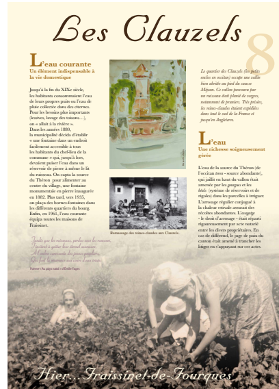
Le graphisme du sentier « Hier... Fraissinet-de-Fourques » (13 panneaux)