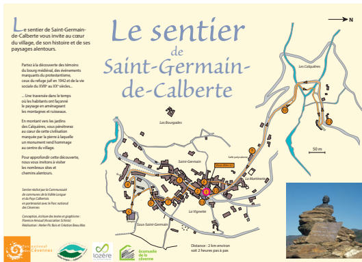
Le sentier de Saint-Germain-de-Calberte (13 panneaux)